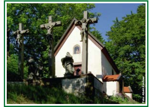
Kreuzigungsgruppe vor der Kapelle am Battenstein