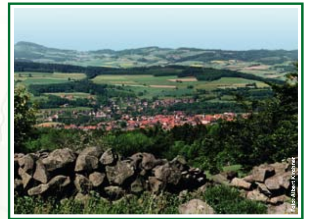
Blick über Hilders zur Milseburg