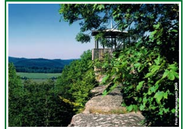
Aussichtspavillon auf der Außenmauer der Ruine Auersburg